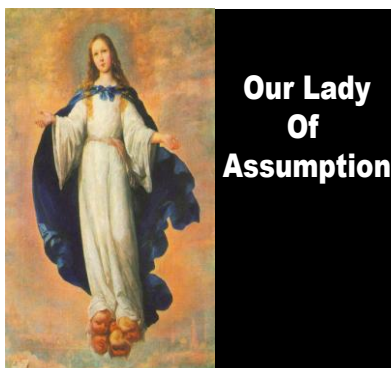
Our Lady Of Assumption

María y José preservaron su virginidad en el matrimonio, optando por aceptar el milagro del nacimiento Jesús como fruto de su amor matrimonial. CIC 499: La profundización de la fe en la maternidad virginal ha llevado a la Iglesia a confesar la virginidad real y perpetua de María incluso en el parto del Hijo de Dios hecho hombre. En efecto, el nacimiento de Cristo "lejos de disminuir consagró la integridad virginal" de su madre. La liturgia de la Iglesia celebra a María como la "Aeiparthenos", la "siempre-virgen".