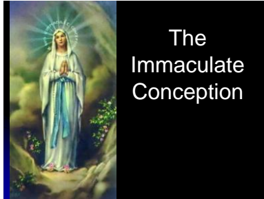
The Immaculate Conception

Objetivo General: Proveer un conocimiento básico sobre lo que enseña la Santa Madre Iglesia sobre la Santísima Virgen María y la sobre la religiosidad popular.